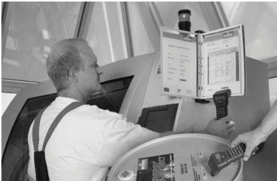
In naher Zukunft werden alle Bearbeitungsfluids über ein Barcode-System bewirtschaftet werden.

Prozessoptimierung und Effizienzsteigerung sind in der metallverarbeitenden Industrie aktueller denn je. MOTOREX hat durch seine langjährige Einsicht in die Branche erkannt, dass immer noch ein ungeahntes Potential in der gleichzeitigen Optimierung mehrerer Einflussgrößen im Bereich der Bearbeitungsfluids liegt.