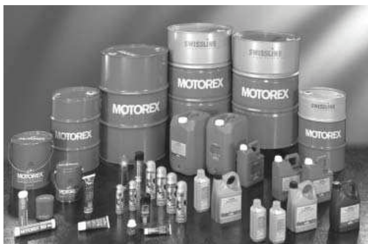
Die einzigartige Produktpalette deckt sich ideal mit den Bedürfnissen der Anwender.

MOTOREX AG LANGENTHAL Kundendienst Postfach CH-4901 Langenthal oder senden Sie ein e-mail an: motorex@motorex.ch