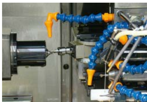
Appareil inclinable 0 – 90° en contre-opération sur DECO 13a