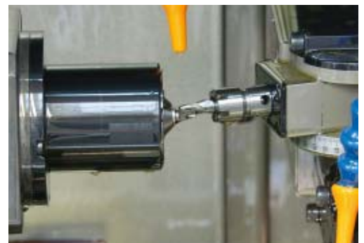
Contre-opération sur DECO 13a