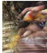
Die MOTOREX 'max-Technology'