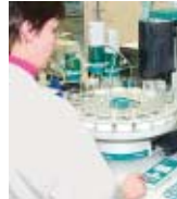
Kühlschmierstoffe MOTOREX SWISSCOOL