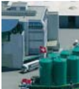
Porträt der MOTOREX AG