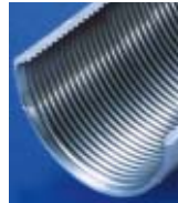
Vergleichstest Schneidöl ORTHO 400