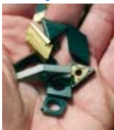
Werkzeugkosten spürbar senken