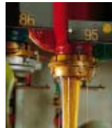
Universalschneidöl MOTOREX ORTHO NF-X