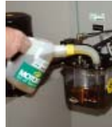
MOTOREX Process Fluid Management