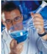
Die Aufgaben des Hydrauliköls