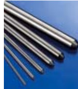
Titanbearbeitung mit MOTOREX ORTHO 300