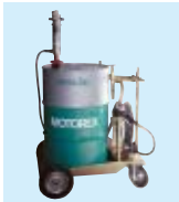
TOPTECH-Pflege- und Wartungsgeräte