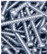
Im Detail: präzises Gewindewirbeln