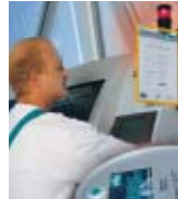
Das MOTOREX Industrie-Konzept