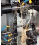
Schneidöle MOTOREX SWISSCUT