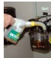
DECO Magazine 24