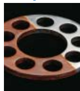
DECO Magazine 15

Consigli di manutenzione per lubrificanti-refrigeranti