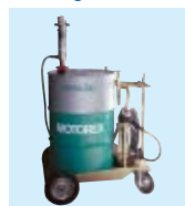
DECO Magazine 17

Testo comparativo olio da taglio ORTHO 400