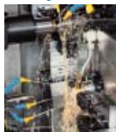
DECO Magazine 18