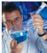
DECO Magazine 22