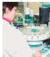
DECO Magazine 19

Refrigeranti-lubrificanti MOTOREX SWISSCOOL