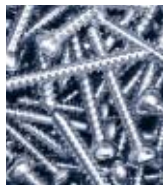
DECO Magazine 26