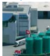
DECO Magazine 12

Vogliate cortesemente farmi pervenire le informazioni sulle tematiche recensite e sui prodotti impiegati (apporre una crocetta corrispondente a quanto richiesto)