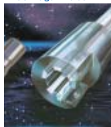
DECO Magazine 30

Ridurre sensibilmente i costi di utensileria