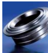
DECO Magazine 21