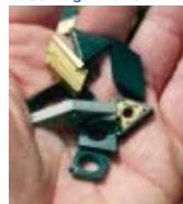
DECO Magazine 29

Ridurre sensibilmente i costi di utensileria