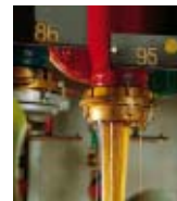
DECO Magazine 28

Olio da taglio universale- TM ORTHO NF-X