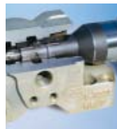
DECO Magazine 25