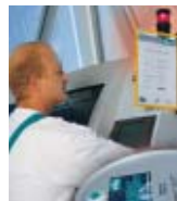
DECO Magazine 23