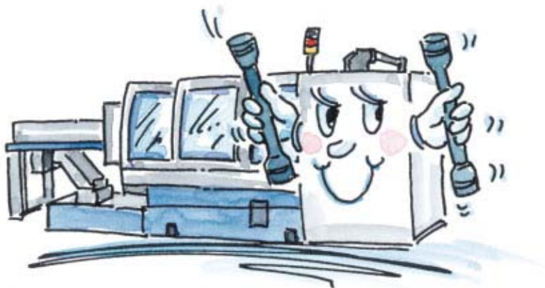
Nuova MULTIDECO 20/8d, la possibilità di realizzare particolari complessi sia in operazione che in contro-operazione.

RS: Il progresso tecnologico deve basarsi sulle esigenze del cliente.