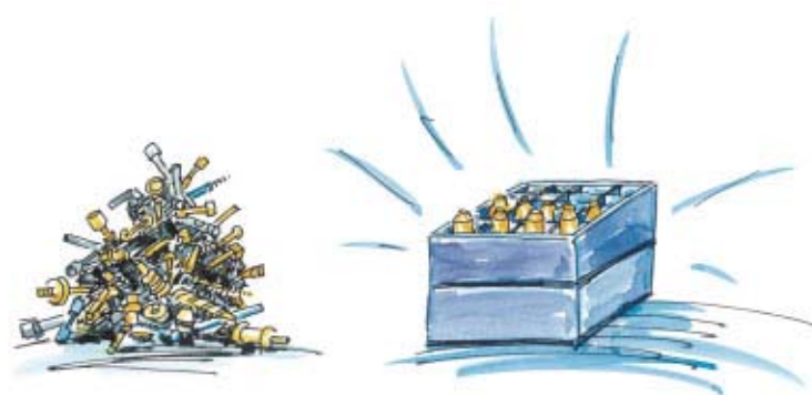
Sistema di palettizzazione su MultiDECO, una flagrante differenza confrontata con l'uscita alla rinfusa.