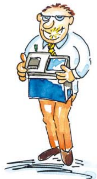
Un cliente soddisfatto rappresenta un buon indicatore!

RS: Li invito calorosamente a comunicarci tutte le loro nuove idee, le osservazioni e le critiche, poiché è grazie alla loro collaborazione che deterremo insieme la "chiave del successo"!