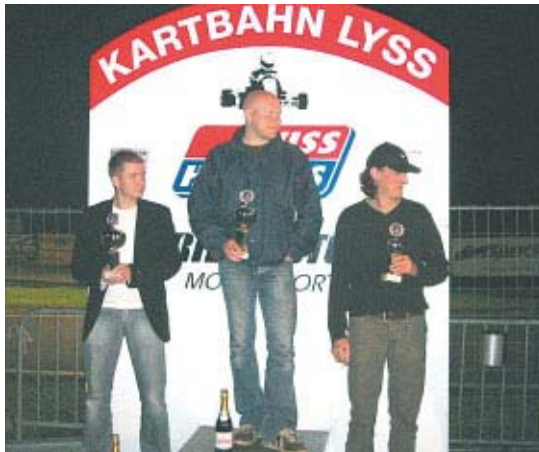
Grande distribuzione di premi.