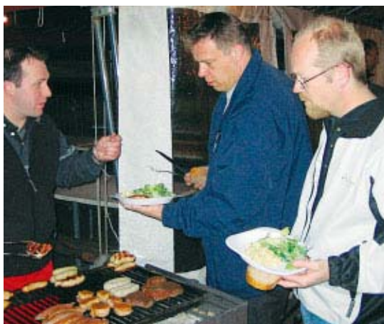
Una meritata cena.