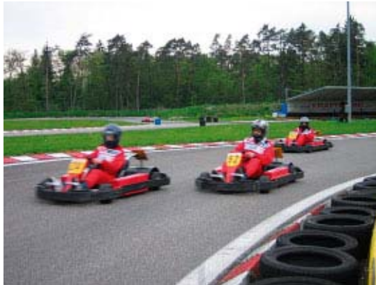
A fondo sulla pista.