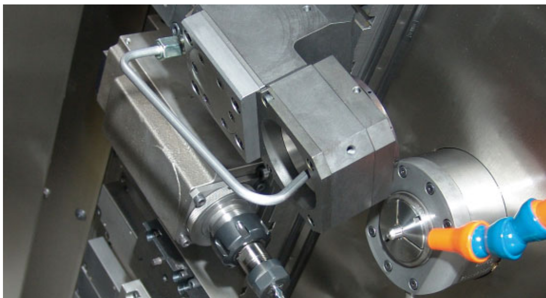
Apparecchio per turbinare su DECO Sigma 20.