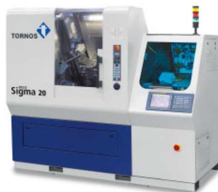
DECO Sigma 20, un altro mezzo per produrre particolari medicali.