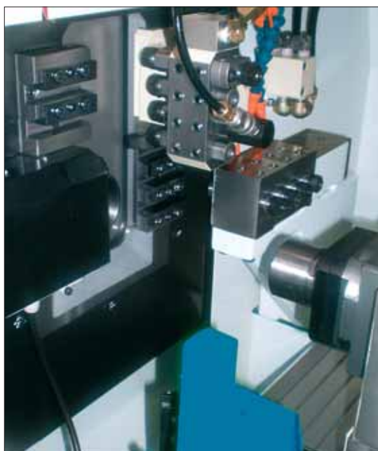
A 3, 4 o 5 assi, con o senza utensile girevole, la gamma Delta propone un'interessante alternativa ai prodotti già presenti sul mercato.

cato richiede abitualmente un'elevata capacità reattiva? Quali saranno i vostri termini di consegna?