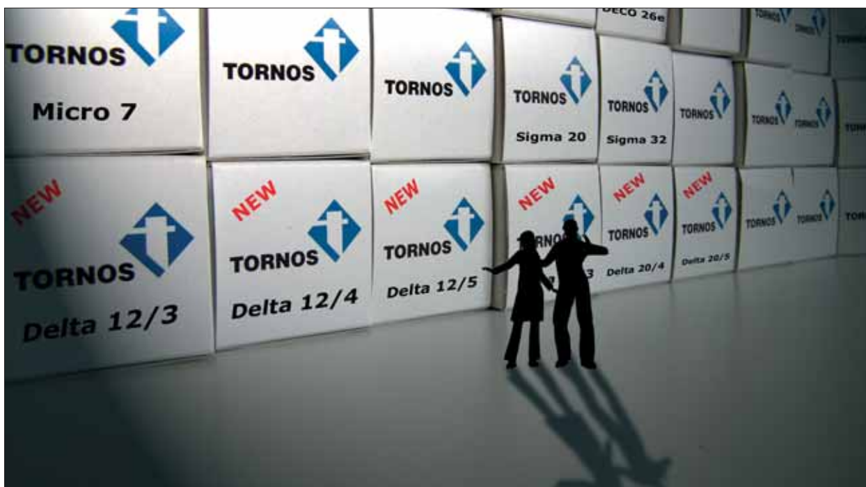
L'assortimento Tornos si vede completato da 9 modelli! Una grande scelta di prodotti mirati a disposizione della clientela.

In occasione delle principali esposizioni europee ed americane, che si svolgeranno nell'estate dell'anno in corso, Tornos presenterà la sua nuova gamma Delta. Questa serie di macchine, nate dall'accordo conclusosi con la Tsugami, si articola su nove modelli da 12 e 20 mm, 3, 4 e 5 assi 1 e completa l'offerta del fabbricante svizzero per le soluzioni di lavorazione più semplici.