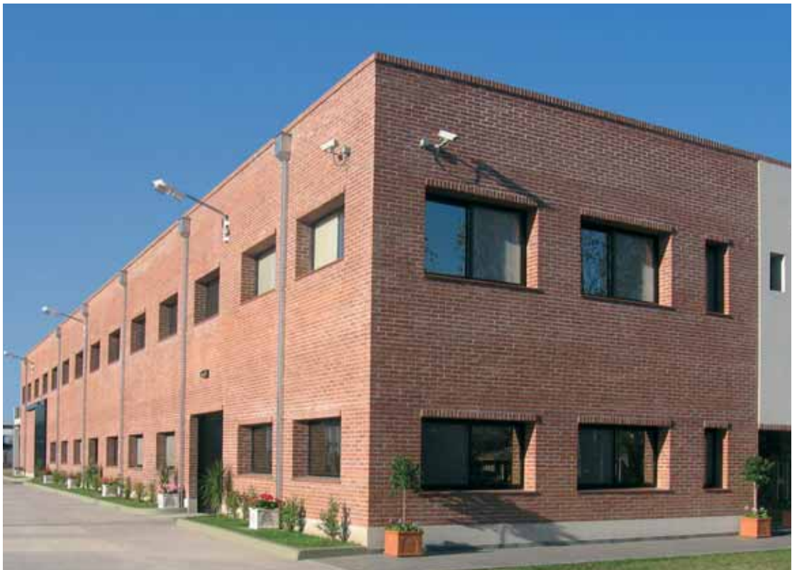
La recién estrenada fábrica de Libertini, apenas terminada (tan nueva que aún no se han colocado el logo en la fachada); 1.500 metros cuadrados al servicio de la precisión.

En el sector mecanizado contamos con personal con experiencia en tornos automáticos a levas y con