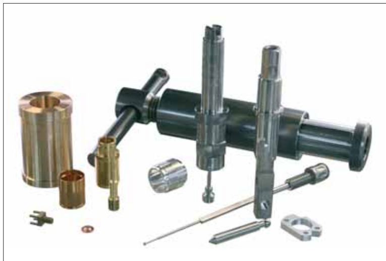
Campionatura di particolari realizzati negli stabilimenti Duchosal.

mobile, con il suo passaggio barra massimo di 32 mm, ben si confà alla filosofia aziendale. Benché questo tornio sia previsto per la lavorazione di particolari complessi ed altamente sofisticati, Jean-Christophe Duchosal vede questa scelta anche sotto un altro aspetto: «lo voglio dei torni sui quali sia possibile realizzare particolari complessi ma anche particolari semplici. Con un tornio meno sofisticato sarei più facilmente limitato nelle mie capacità».