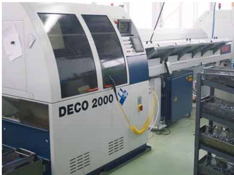
Nel parco macchine della Duchosal si annoverano anche numerose DECO 2000.