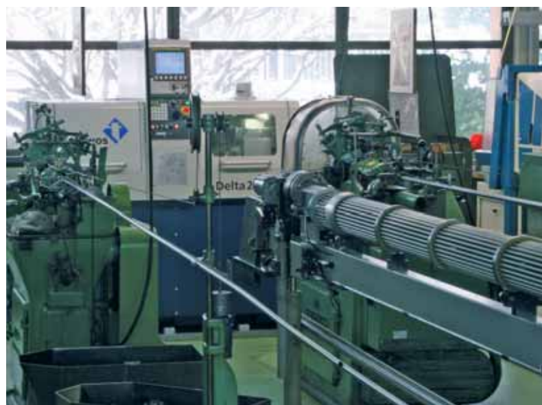
La Delta 20/5 è destinata a sostituire progressivamente i torni a camme.

L'azienda da prova del suo attaccamento a Tornos con il recente completamento della propria gamma di torni automatici costituito dall'acquisto di una DECO 26a e di una Delta 20. La scelta della DECO 26a, un tornio automatico monomandrino a fantina