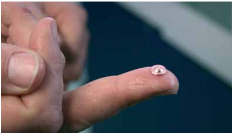
Particolare realizzato sul tornio Delta.