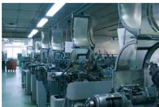
I torni a camme forniscono ancora un buon servizio.

macchine a camme.» In effetti, il numero dei particolari per serie varia dai 50 pezzi ad un milione, ed anche oltre, ma ordini di questa entità si fanno sempre più rari.