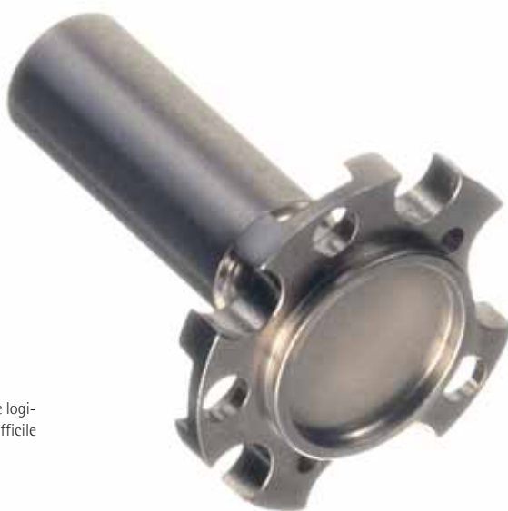
Pièce typique usinée chez Décovi. Sans le logiciel GibbsCAM, cette pièce serait très difficile voire impossible à programmer.