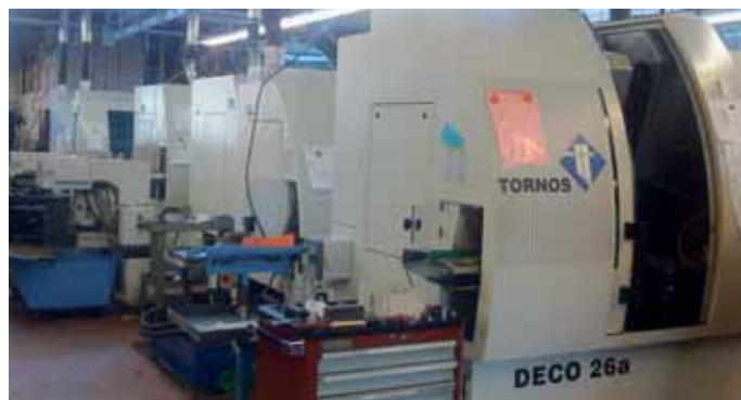
Vue partielle de l'atelier des DECO chez Décovi. Elles sont toutes reliées au système centralisé d'évacuation des vapeurs d'huile.

Claude Chèvre: L'utilisation du logiciel GibbsCAM est un investissement indispensable et très profitable. Son introduction nécessite néanmoins un pilotage interne strict et un fournisseur compétent. Il est très important de monter un projet avec un programme de formation préétabli et des étapes d'introduction bien définies dans les départements. Il ne faut pas négliger la planification du temps machine nécessaire pour tester et valider le fonctionnement des post-processeurs.