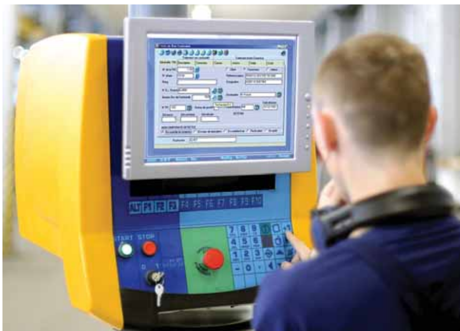
Software molto intuitivo, Clipper è particolarmente ben affermato presso le aziende della meccanica, dell'orologeria, della fabbricazione di prodotti puliti, di impianti di caldaie, di fabbriche di lamiere in grandi serie e di macchine speciali.