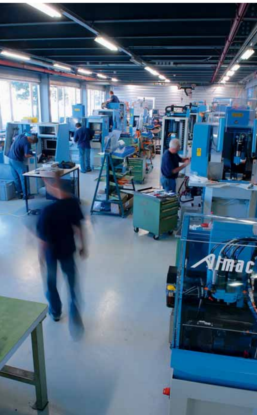
Prima fabbrica di macchine-utensili ad utilizzare Clipper, Almac è cresciuta con il software. Gli utilizzatori sono unanimi nel confermare la semplicità e l'efficacia del sistema.