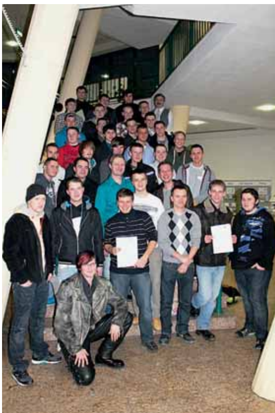
Turma de conclusão do curso técnico para "mecânico de usinagem 2012".

usinagem nas instalações de Pirna seja sempre realizada e, além disso, para que sejam asseguradas as melhores condições de formação.