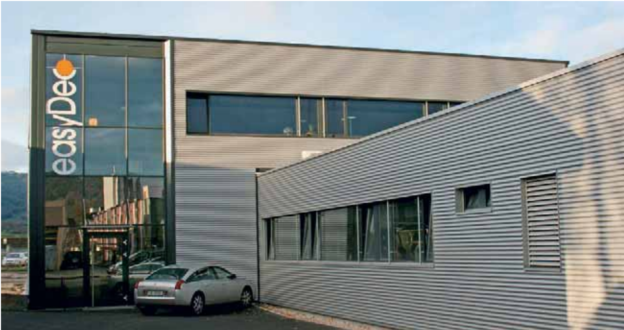
在Delémont刚刚建成的、超现代化的公司大楼内，两个楼层里的机床正在日夜运行。

如果想了解更多的关于新一代的Ortho切削油、在你本领域内最佳应用情况以及Easydec可提供的产品?请与我们联系: