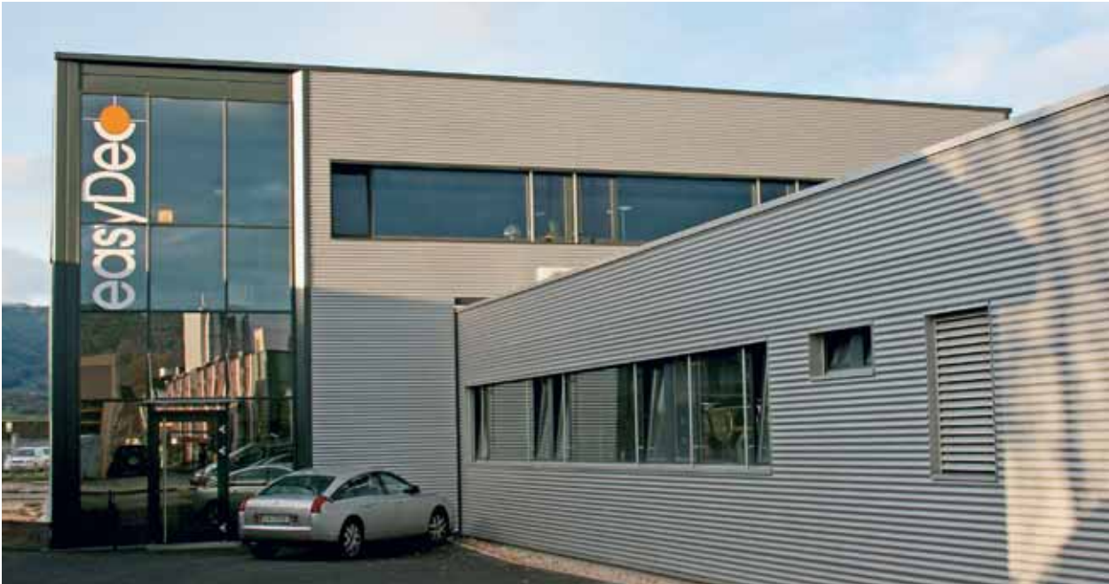
Im kürzlich erstellten und topmodernen Firmengebäude in Delémont arbeiten die Maschinen auf zwei Stockwerken rund um die Uhr.

Parameter erfassen, welche über die aktuellen Qualitäts- und Leistungswerte informieren. Aber das sei noch Zukunftsmusik, schwärmt der enthusiastische Patron.