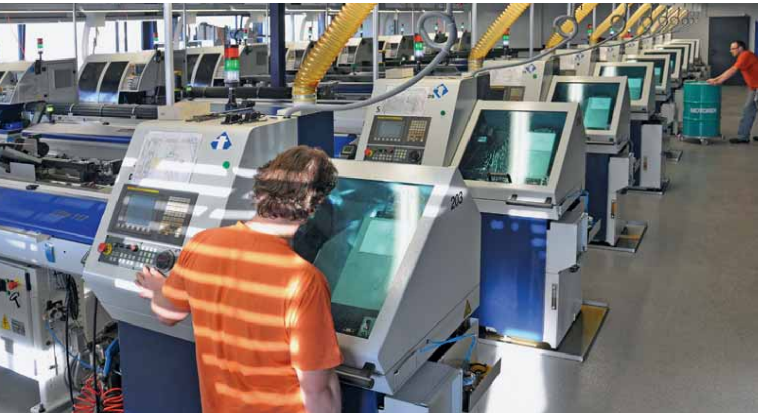
Eine beeindruckende Anzahl von Tornos CNC-Décolletagemaschinen, hier im ersten Stockwerk, leisten rund um die Uhr ganze Arbeit.

Verbesserungsmöglichkeiten hin. Werden diese umgesetzt, leuchtet das Balkendiagramm danach in grüner Farbe.