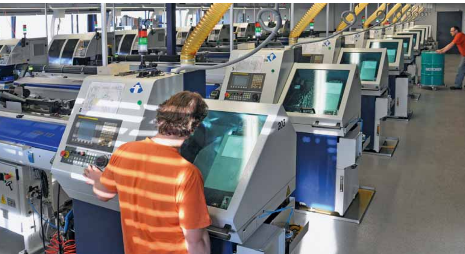
Una cantidad sorprendente de máquinas de mecanizado CNC de Tornos, aquí en la primera planta, trabajan sin cesar las 24 horas del día.

de producción simultáneamente. El estado de producción de cada máquina aparece representado en un eje de tiempo. Las fases rojas avisan de posibles mejoras. Si dichas mejoras se aplican, el diagrama de barras vuelve a iluminarse en color verde.