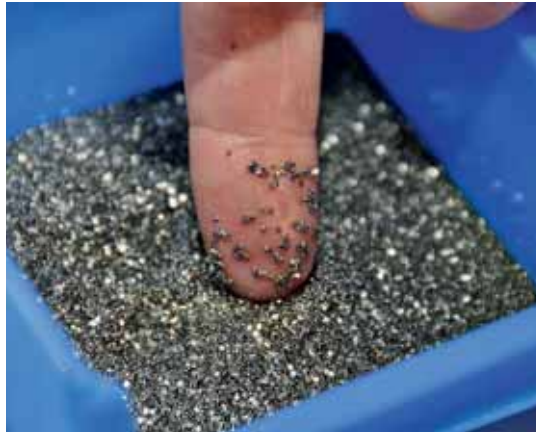
A occhio nudo è quasi impossibile fare la distinzione tra i numerosi particolari di precisione destinati all'orologeria, quali delle viti con una lunghezza di 1,19 mm destinate ai movimenti meccanici.