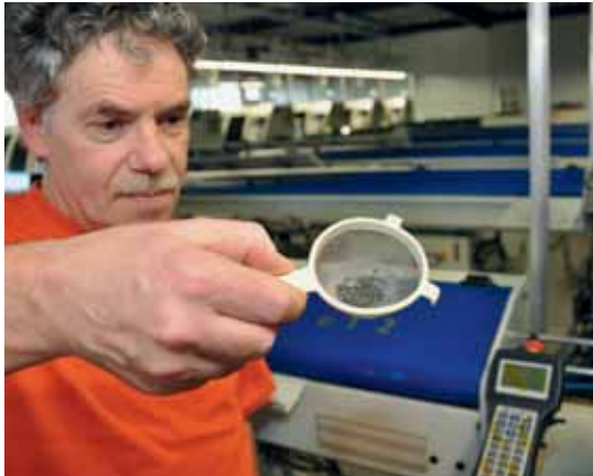
Un responsabile della qualità di Easydec, sta prelevando da una macchina un campione di vite con lo scopo di misurarlo.