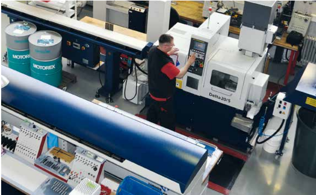
Bei itp findet der gesamte Produktionsprozess unter einem Dach statt. Die helle und logistisch durchdachte Werkhalle befindet sich in einem ehemaligen Gebäude der Völklinger Hütte ( www.voelklinger-huette.org ).

Messergebnis. Im Rechner wird der Ist- mit dem Sollwert verglichen und daraus das Resultat berechnet. Die Antastpunkte werden mit sogenannten Tastern am Werkstück erfasst (Hauptbild). Die Herstellung dieser Taster sowie weiterer Messtechnik-Komponenten sind die Kernkompetenz des innovativen Unternehmens itp.