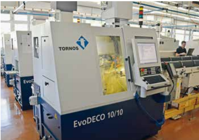
Die Werkstatt der Firma Krattiger ist mit rund zwanzig EvoDeco- und Deco-Maschinen gut ausgestattet. Die Räumlichkeiten sind gross genug, um weitere Maschinen, darunter mehrere SwissNano, aufzunehmen.