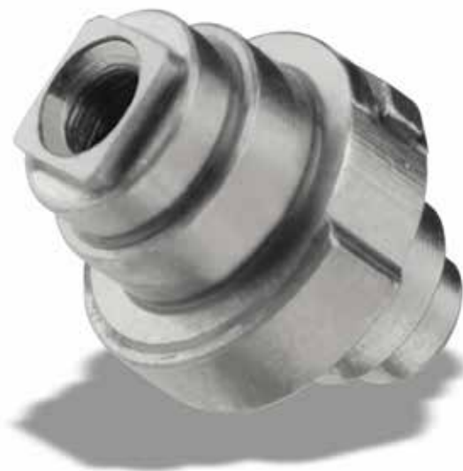
Die Federwelle ist ein Uhrenbauteil, dessen Komplexität die SwissNano an ihre Grenzen bringt. Um die Palette an möglichen Bearbeitungen auf der SwissNano weiter auszubauen, beabsichtigt die Firma Krattiger, demnächst den Verzahnungsapparat zu testen.

licht die präzise Zentrierung der Werkzeuge und die Hauptbearbeitungen sind sehr vereinfacht. Mit 13 Werkzeugpositionen (und es sind sogar Doppelwerkzeughalter möglich) decken wir locker die 80% der Uhrenbauteile ab, die wir anstreben.“ Fragt man Brosy nach der Entladung der Werkstücke, unterstreicht dieser die hervorragende Stabilität der Vorrichtung: „Die Gegenspindel nimmt die Auswurfposition ein und das bearbeitete Werkstück wird in ein Auffangrohr aus Kunststoff geblasen. Dies ist optimal und die Werkstücke werden nie beschädigt.“