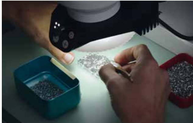
Um seinen Kunden Komplettlösungen anzubieten, verfügt das Unternehmen über verschiedene Abteilungen, die die Drehteilfertigung ergänzen, beispielsweise für das Polieren oder Rollieren. Die auf der SwissNano gefertigten Federwellen werden gehärtet (bei einem Partner) und vor Ort rolliert und kontrolliert.

insbesondere für die Offsets und die Stangenladung. Ein Programmierer, der sich gut mit ISO auskennt, wird sich sehr schnell zurechtfinden.“ Und weiter: „Auch der Werkzeugwechsel gestaltet sich sehr angenehm. Der Arbeitsbereich ist gut zugänglich und es können auf dem Markt erhältliche Standardwerkzeuge montiert werden, ohne sie zuerst abändern zu müssen, wie dies bei kleinen Maschinen für die Fertigung von Uhrenbauteilen oft der Fall ist.“ Arrieta ergänzt: „Auch die Maschinenkinematik ist sehr durchdacht. Die Gegenspindel auf 3 Achsen ermög-