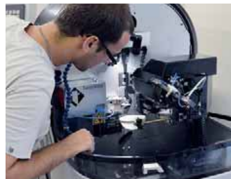
Il design della macchina è plebiscitato da Oxomedic, la visibilità e il comando girevole ne fanno un utensile da utilizzare molto conviviale.