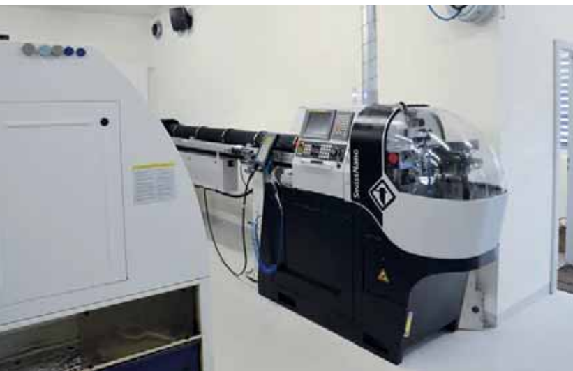
L'ingombro della macchina SwissNano consente di posizionarla in locali relativamente esigui.