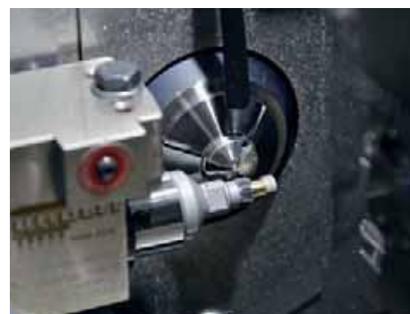
Oxomedic realizza tutti i tipi di particolari tagliati e ultimati sulla macchina, il dispositivo di taglio è molto semplice da mettere in opera.