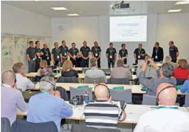
A participação no Treinamento Internacional Motorex mobilizou não apenas parceiros de negócios de vários países diferentes, mas também toda a equipe de profissionais da indústria da Motorex.