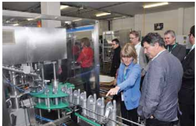
Durante una visita a la planta se pudieron descubrir las más modernas instalaciones de fabricación en funcionamiento. Motorex tiene su sede en la planta de producción de Langenthal y apoya a sus socios con un fuerte servicio técnico.

clientes del sector de las técnicas de lubricación para la industria soluciones de gran calidad y competencia.