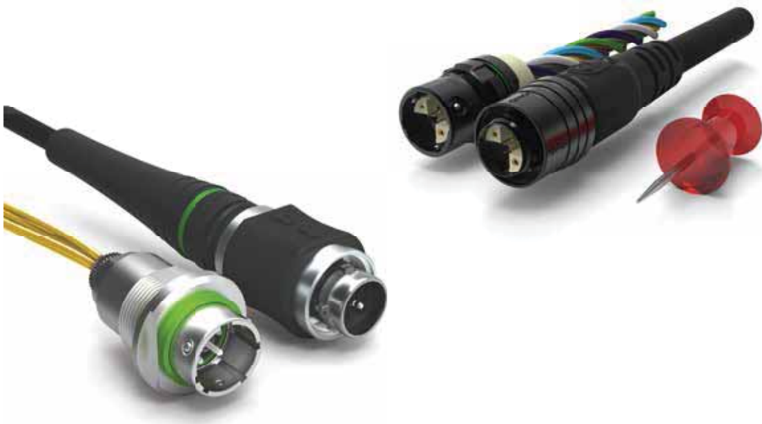
产品: Fischer MiniMax™ 系列和Fischer FiberOptic 系列

车床操作工目前的真正挑战是在多达5轴联动的更加强大的车床上, 对日益复杂的工件进行快速编程。在模拟过程中对碰撞和断裂进行检测是减少机床调试时间不可缺少的步骤。请看Fischer Connectors公司是如何使用Mastercam Swiss Expert来管理自己的设备编制的。