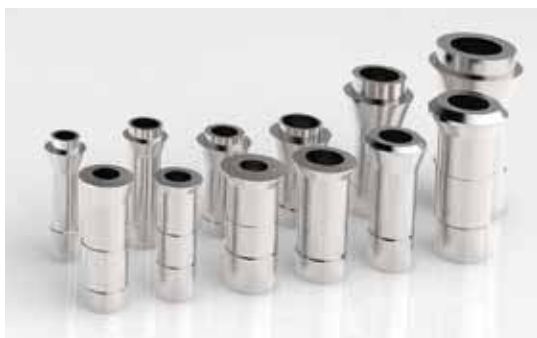
夹具和导套作为机床标准件提供的范例。

为了不断地满足用户的实际需要和要求，新版本Mastercam Swiss Expert 13 对夹具和导套进行一体化集成管理。这些都作为机床环境的标准件提供。导套和夹具也可以进行3-D定制设计，包括这些元器件碰撞检测用的专用夹具“长端头”在内。