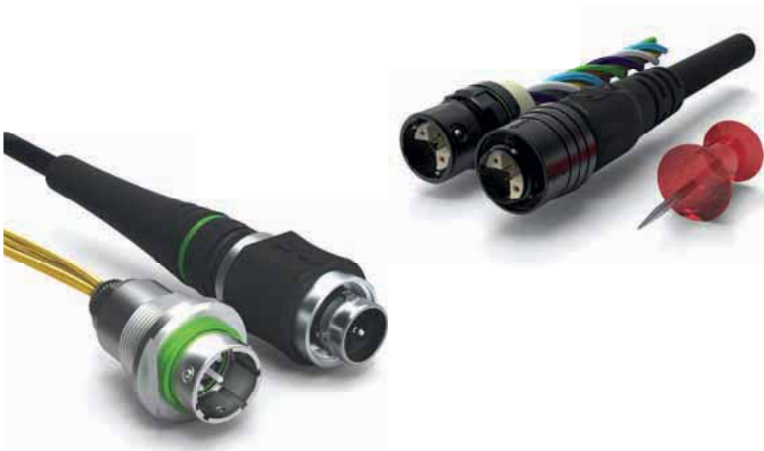
Productos Serie Fischer MiniMax™ y Serie Fischer FiberOptic.

El desafío real del tornero actual es programar con rapidez piezas cada vez más complejas en tornos con unas prestaciones cada vez más elevadas y con hasta 5 ejes simultáneos. Es imprescindible detectar las colisiones y las salidas de recorrido en una simulación para reducir el tiempo de puesta en marcha. Conozca el testimonio de Fischer Connectors, que controla su parque de máquinas con Mastercam Swiss Expert.