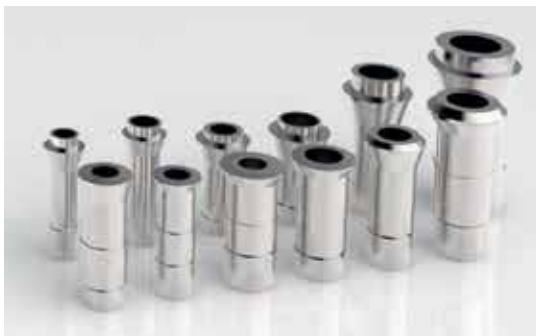
Ejemplos de cañones y pinzas estándares entregados con la máquina.

Con el objetivo de estar siempre más cerca de la realidad y en respuesta a la demanda de los usuarios, la nueva versión 13 de Mastercam Swiss Expert integra y gestiona las pinzas y los cañones. Se entregan de serie con los entornos de las máquinas. Además, pueden dibujarse cañones y pinzas en 3D a medida; por ejemplo, pinzas «de punta larga» específicas, para detectar las colisiones con estos elementos.