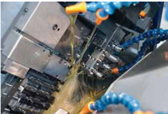
Motorex Ortho NF-X特别适用于TS Décolletage SA所使用的各种加工中心。Tornos和Motorex之间的合作为用户带来了额外的无价之宝。