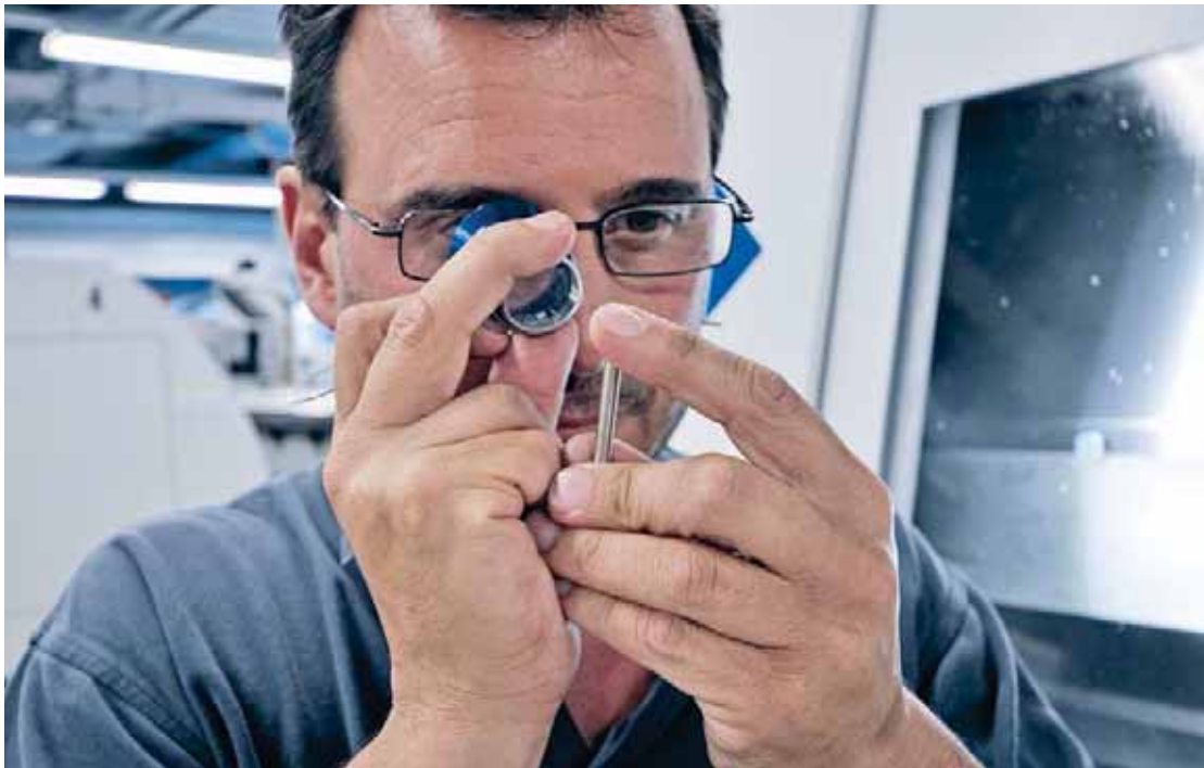
TS Décolletage SA经过 ISO 9001-2000 认证，自其成立以来，一直由业主运营。该公司拥有最先进的设备，并不遗余力地满足严格的客户需求，没有例外。