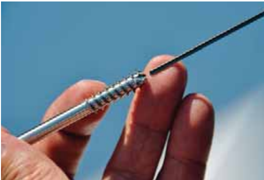
Durch Tests bei einer Tieflochbohrung von 200 mm sind die Verantwortlichen bei der TS Décolletage SA auf die vorteilhaften Eigenschaften von Motorex Ortho NF-X aufmerksam geworden. Heute arbeitet der ganze Produktionsbetrieb damit!

Mit dem Bezug der neuen vollklimatisierten Räumlichkeiten im Jahre 2007 und der Investition in eine neue Maschinengeneration setzt das Unternehmen konsequent auf High-Tech. So werden immer häufiger äusserst anspruchsvolle und komplexe Anwendungen von A bis Z in Bedano ausgeführt. Mit den Superfinish-Schleiftechniken, aufwändigen Innenbearbeitungen unterschiedlichster Materialien (Titan, Inox, CrNi, Bunt- und Edelmetalle) hat auch das eingesetzte Bearbeitungsfluid einen eklatanten Einfluss auf den Produktionserfolg. Ausschlaggebend für die Umstellung des ganzen Betriebs auf das universelle Hochleistungs-Schneidöl Ortho NF-X von Motorex war eine 200 mm Tieflochbohrung in einem Medizinteilteil mit einer hohen Grundhärte aus Inox 1.4472. Mit dem vorgängig eingesetzten Schneidöl konnten keine befriedigenden Resultate punkto Masshaltigkeit und Stückzeiten erreicht werden. Weil Tornos seine Maschinen mit Bearbeitungs- und Betriebsfluids von Motorex entwickelt und in Betrieb nimmt, kennt der Maschi-