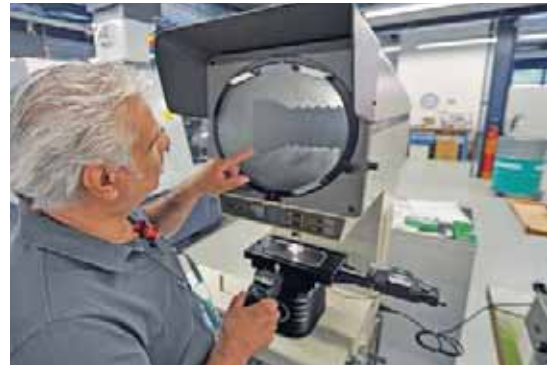
Die Qualitätskontrolle ist ein zeitintensiver, aber besonders wichtiger Schritt auf dem Weg zu einem perfekten Endresultat. Bei TS Décolletage in Bedano werden eigens auf die Bedürfnisse der verschiedenen Kunden ausgelegte Prüfprozedere angewendet.