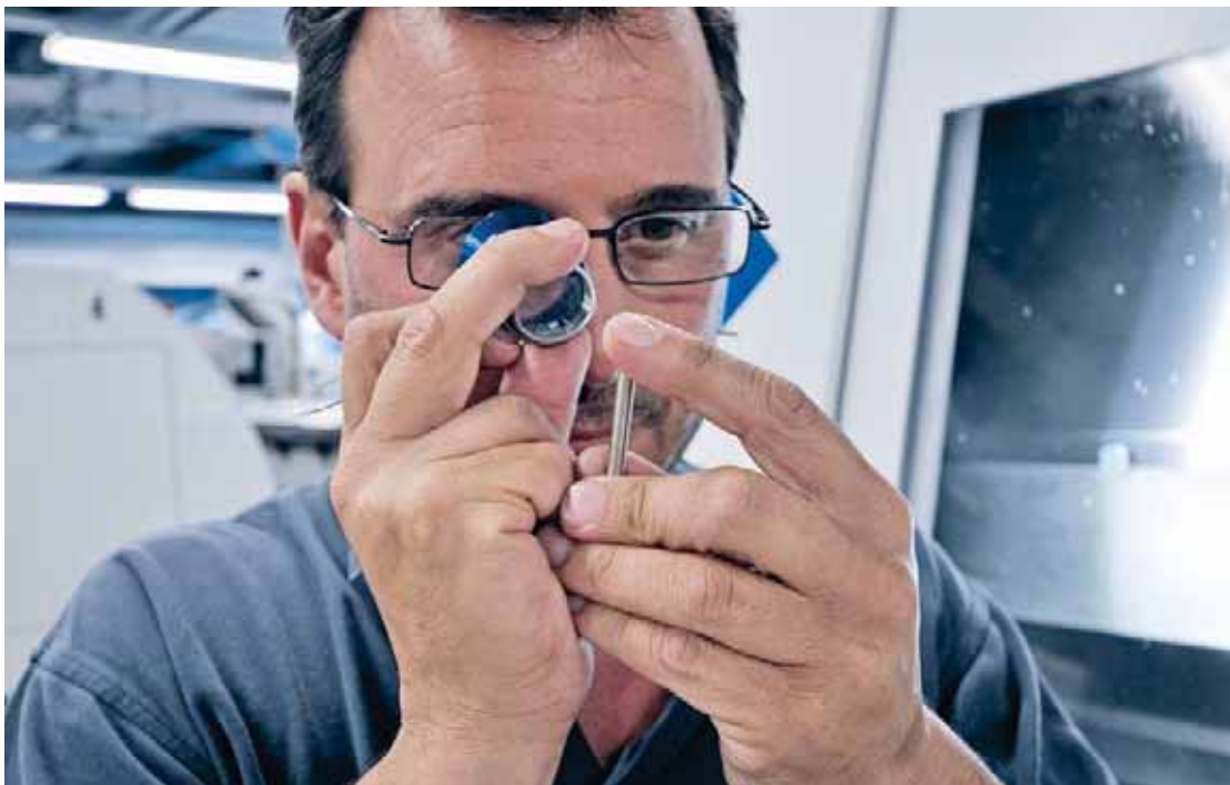
Die TS Décolletage SA ist ISO 9001-2000 zertifiziert und seit deren Gründung unternehmergeführt. Dabei setzt der modern ausgerüstete Betrieb alles daran, die hohen Erwartungen der Kundschaft immer ein wenig zu übertreffen.