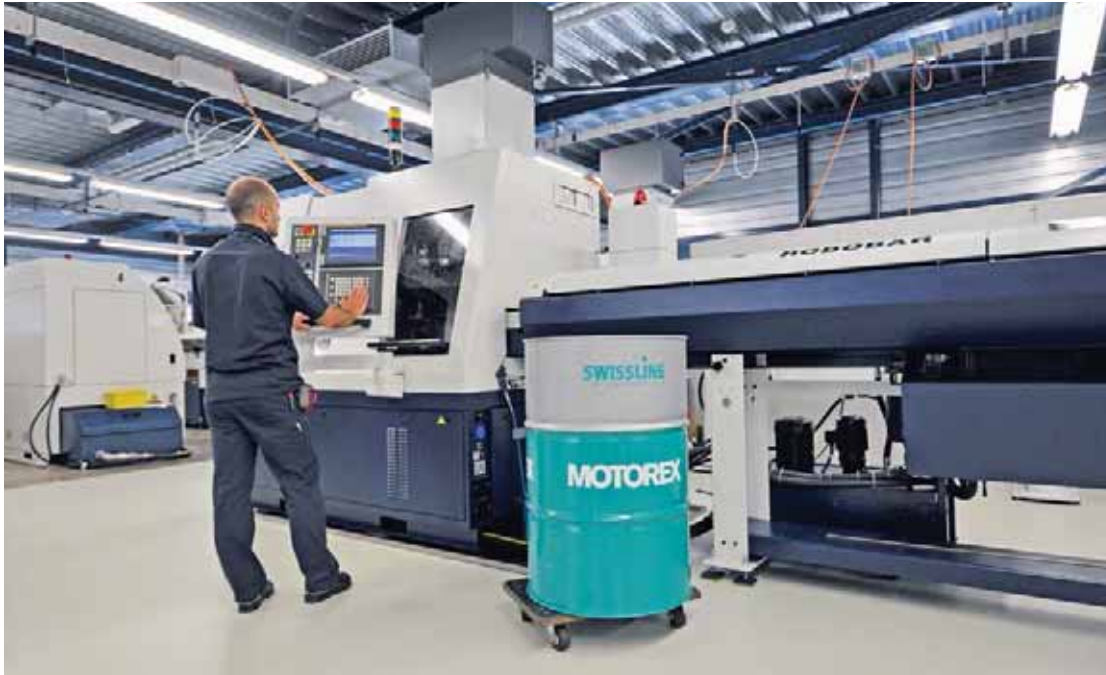
In den exakt auf 23° C klimatisierten und optimal belüfteten Räumlichkeiten arbeitet es sich besonders angenehm, und die Wiederholbarkeit der komplizierten Bearbeitungsprozesse ist unter den gleichen klimatischen Bedingungen stets garantiert.

nenhersteller deshalb aus erster Hand das geeignete Produkt von Motorex und löste die Aufgabe mit Bravour.