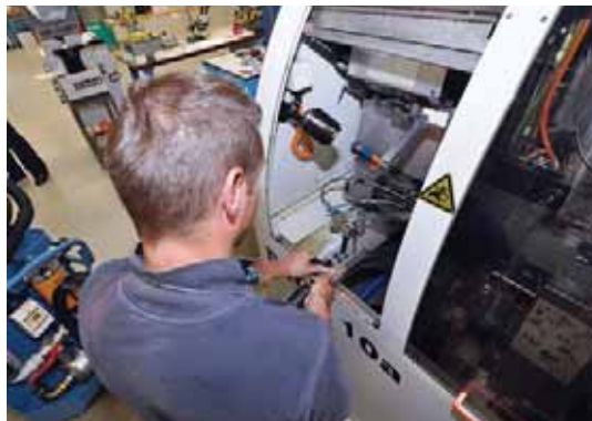
A seconda di materiali e processi, le macchine vengono pulite a intervalli accuratamente definiti e l'olio da taglio viene filtrato finemente e integrato. Questo avviene singolarmente in quanto non è installato alcun impianto di alimentazione centrale.

Dopo le esperienze fatte con prodotti di altri fornitori, gli imprenditori si sono resi conto del valore del fluido di lavorazione utilizzato. Quello che a prima vista appariva uguale (olio da taglio = olio da taglio), in condizioni d'uso difficili rivelava la differenza sotto forma di stabilità dimensionale, finitura superficiale ( R_a -valore), durata di vita degli utensili e tempo di produzione. L'olio da taglio universale ad alte prestazioni Ortho NF-X di Motorex ha dimostrato i suoi «valori interni» con una riduzione del tempo di produzione nel pezzo di ingegneria biomedica suddetto di ben -31%! Naturalmente nel rispetto delle severe tolleranze e della finitura superficiale desiderata. Con il fluido di lavorazione Swisscut Ortho NF-X privo di cloro e di metalli pesanti, Motorex è riuscita a ottenere, con un unico olio da taglio, una lavorazione perfetta sia di acciai alto-legati e acciai per impianti che di metalli non ferrosi e alluminio. Questa è un'assoluta novità per la moderna tecnologia di produzione e garantisce agli utenti la massima libertà di azione. Consente di utilizzare il fluido