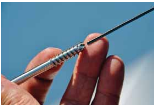
Grazie a test con una foratura profonda di 200 mm, i responsabili di TS Décolletage SA si sono accorti delle vantaggiose proprietà di Ortho NF-X di Motorex. Oggi viene utilizzato per l'intera produzione.

Con i nuovi locali completamente climatizzati nel 2007 e l'investimento in una nuova generazione di macchine l'azienda è diventata High-Tech. A Bedano vengono quindi realizzate sempre più spesso, dalla A alla Z, applicazioni straordinariamente complesse e impegnative. Con le tecniche di levigatura superfinish, impegnative lavorazioni interne dei materiali più diversi (Titanio, Inox, CrNi, metalli non ferrosi e metalli nobili) anche il fluido di lavorazione utilizzato influisce considerevolmente sul successo della produzione. Decisiva per la decisione dell'azienda di utilizzare l'olio da taglio universale ad alte prestazioni Ortho NF-X di Motorex è stata l'esecuzione di una foratura profonda da 200 mm di un pezzo di ingegneria biomedica con una elevata durezza di base, in Inox 1.4472. Con l'olio da taglio allora in uso non era stato possibile ottenere risultati soddisfacenti in