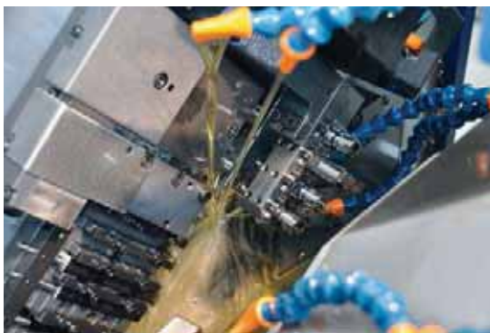
Ortho NF-X di Motorex è adatto a tutti i centri di lavorazione installati presso TS Décolletage SA. La collaborazione tra Tornos e Motorex genera un ulteriore prezioso vantaggio per l'utente.