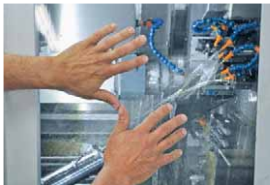
Rinunciando all'uso di materiali problematici in Ortho NF-X e grazie a un fattore di nebulizzazione ridotto si ottiene una elevata qualità del posto di lavoro.