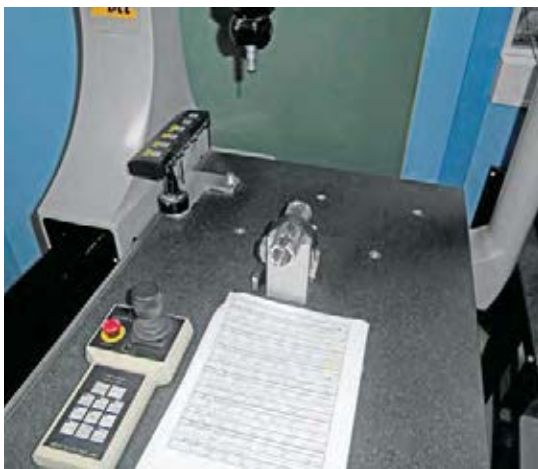
质量控制是一项耗时的工作，但却是取得完美结果的关键步骤。Hallberg-Sekrom采用的许多测试方法都是与客户合作确定的。