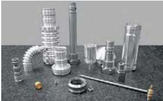
Hallberg-Sekrom的生产跨度令人印象深刻。他的客户包括成功的全球企业如阿特拉斯 (Atlas Copco)。