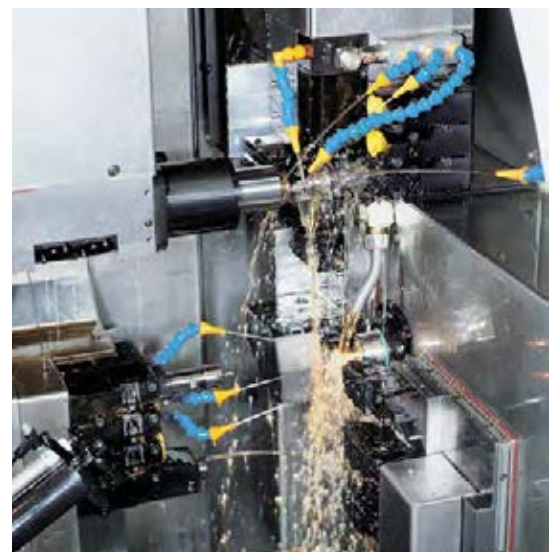
Motorex Ortho NF-X 15切削油被用于大部分的机床。它具有卓越的性能，即使最具挑战性的应用也可应对。