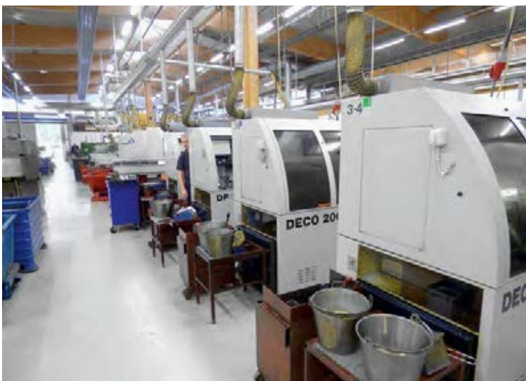
一个屋檐下：具有空调设施的生产厂有约50台不同时期的机床。整个生产过程只需要两种切削液。

目前选择切削液的关键因素是性能、工艺可靠性和价格。Motorex总部设在朗根塔尔，拥有超现代化的实验室和专业的化学家和工程师。该公司的成功产品是持续研发投资，以及与知名机床和刀具制造商几十年密切合作的结果。万能切削液如Motorex Swisscut Ortho切削油和Swisscool Magnum乳化液在国际用户中非常受欢迎。在Hallberg-Sekrom AB，Ortho NF-X 15切削油和水溶的Magnum UX 400冷却润滑剂覆盖整个极为广泛的加工过程。