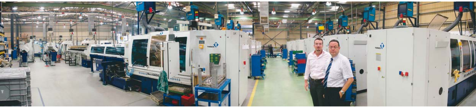
Microdeco公司的部分生产设备视图，左侧后部是Deco机床。数控多轴车床车间前：Microdeco 公司的董事总经理José Iraolagoitia先生（左）和Tornos伊比利亚公司的负责人Isaac Acrich先生。