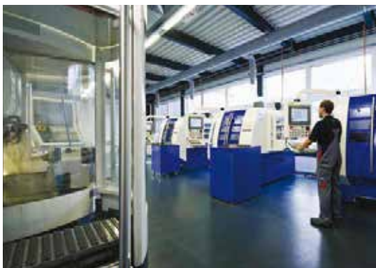
Produção especial para a linha Top-Watch.