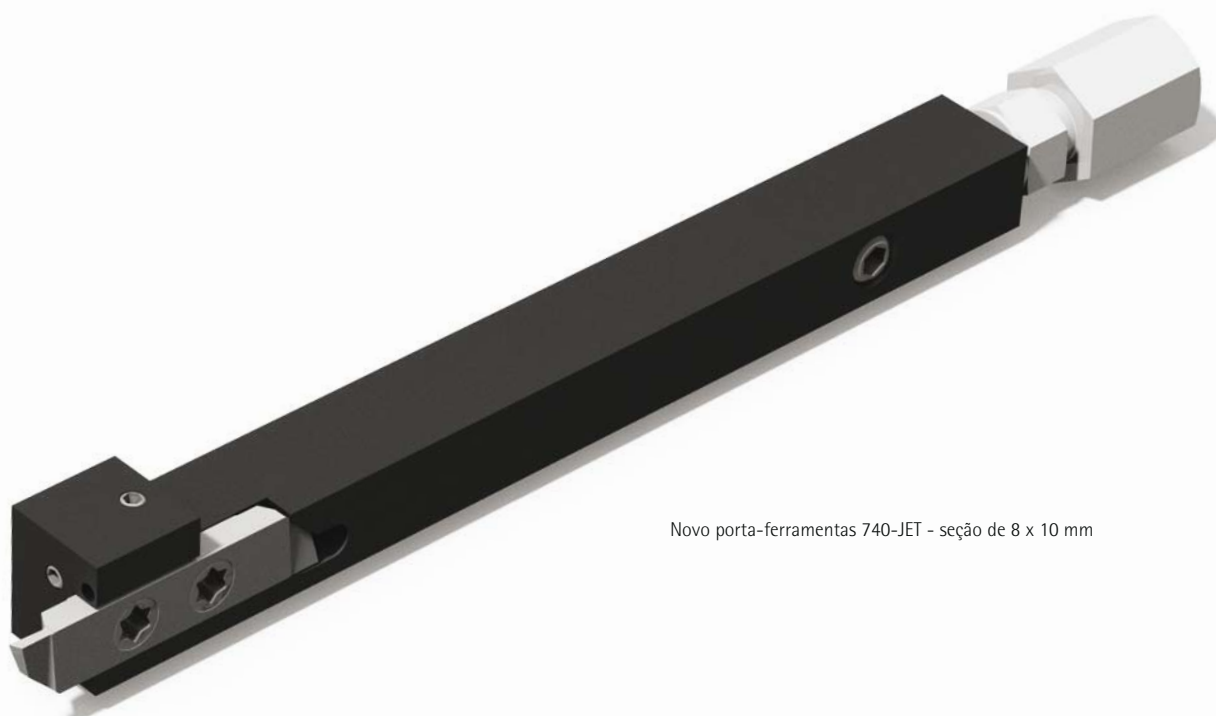
Novo porta-ferramentas 740-JET - seção de 8 x 10 mm

A Applitec Moutier SA tem presença ativa na indústria relojoeira e é especializada em novos processos de fabricação e novos materiais aplicáveis a este segmento. A fabricante suíça oferece uma linha de ferramentas específicas para este setor.