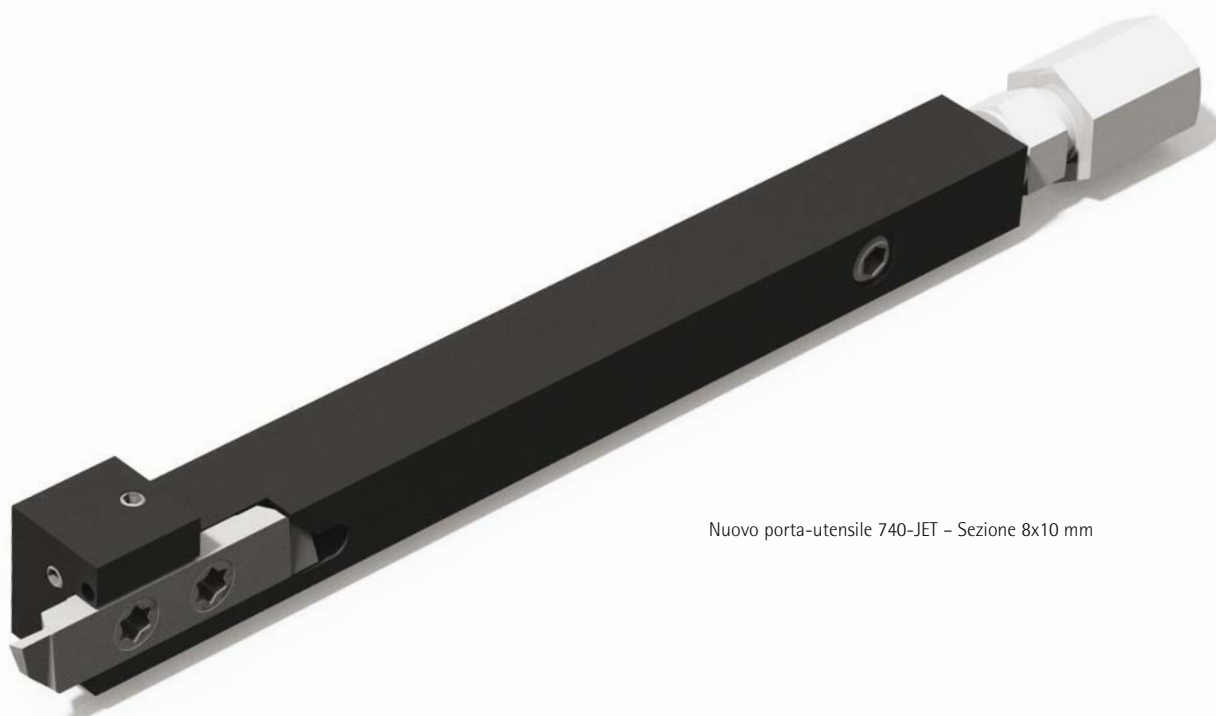
Nuovo porta-utensile 740-JET – Sezione 8x10 mm

Applitec Moutier SA si sente interessata dal settore dell'orologeria, i suoi nuovi processi di fabbricazione e i nuovi materiali utilizzati. Il fabbricante svizzero presenta una gamma specifica in questo settore.