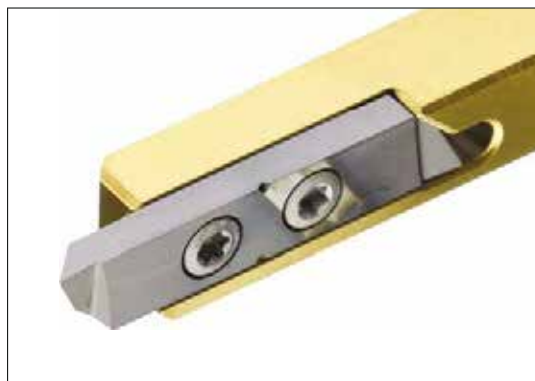
Porta-utensile in metallo pesante antivibrante (Novibra).