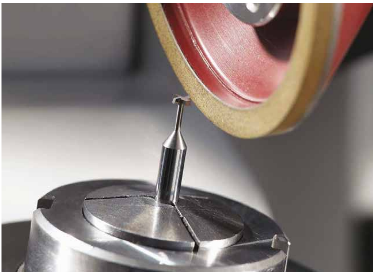
Zahlreiche Spitzenunternehmen der Uhrenindustrie und der Medizintechnik vertrauen auf Werkzeuge von Guymara.