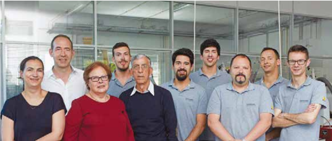
Das kleine Mitarbeiterteam teilt seit 20 Jahren die gleiche Leidenschaft für hohe Qualität und Präzision.