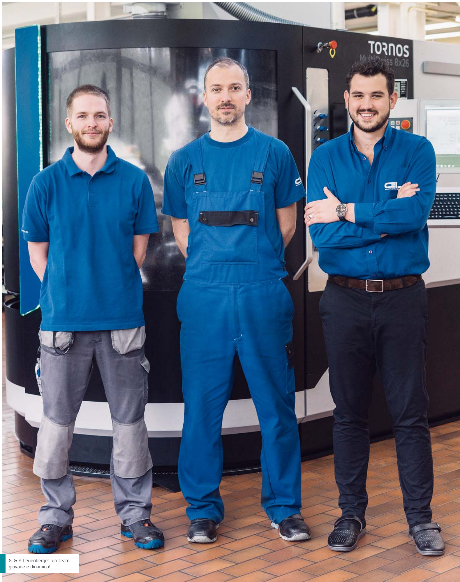
G. & Y. Leuenberger: un team giovane e dinamico!