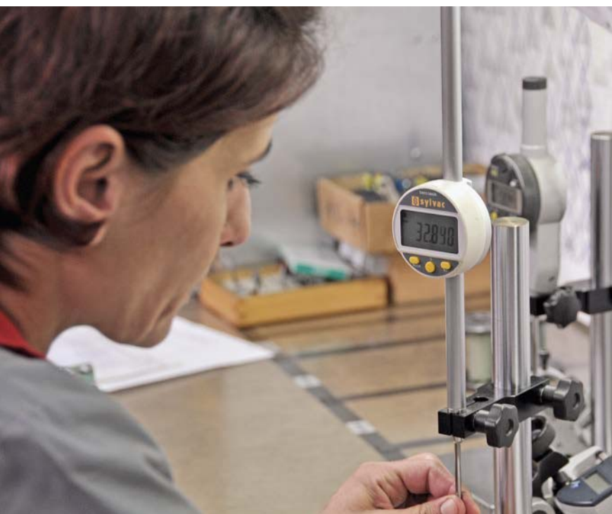
A qualidade pode ser medida. A PréciJura foi certificada de acordo com o ISO 9001 e EN 9100.