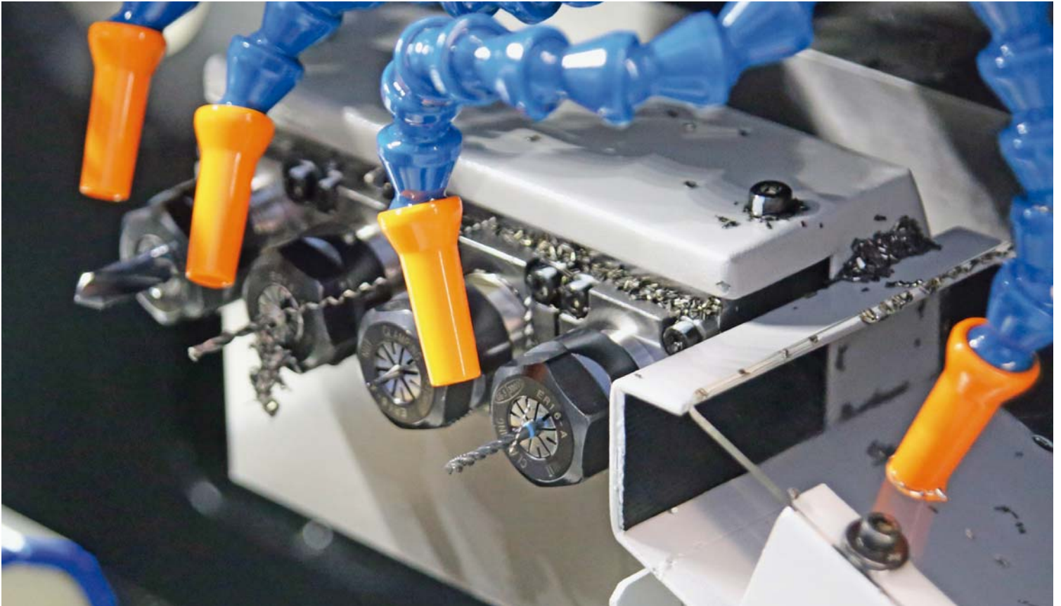
CT 20共有26个刀位。这里显示了用于背面加工的4把刀具位置。。