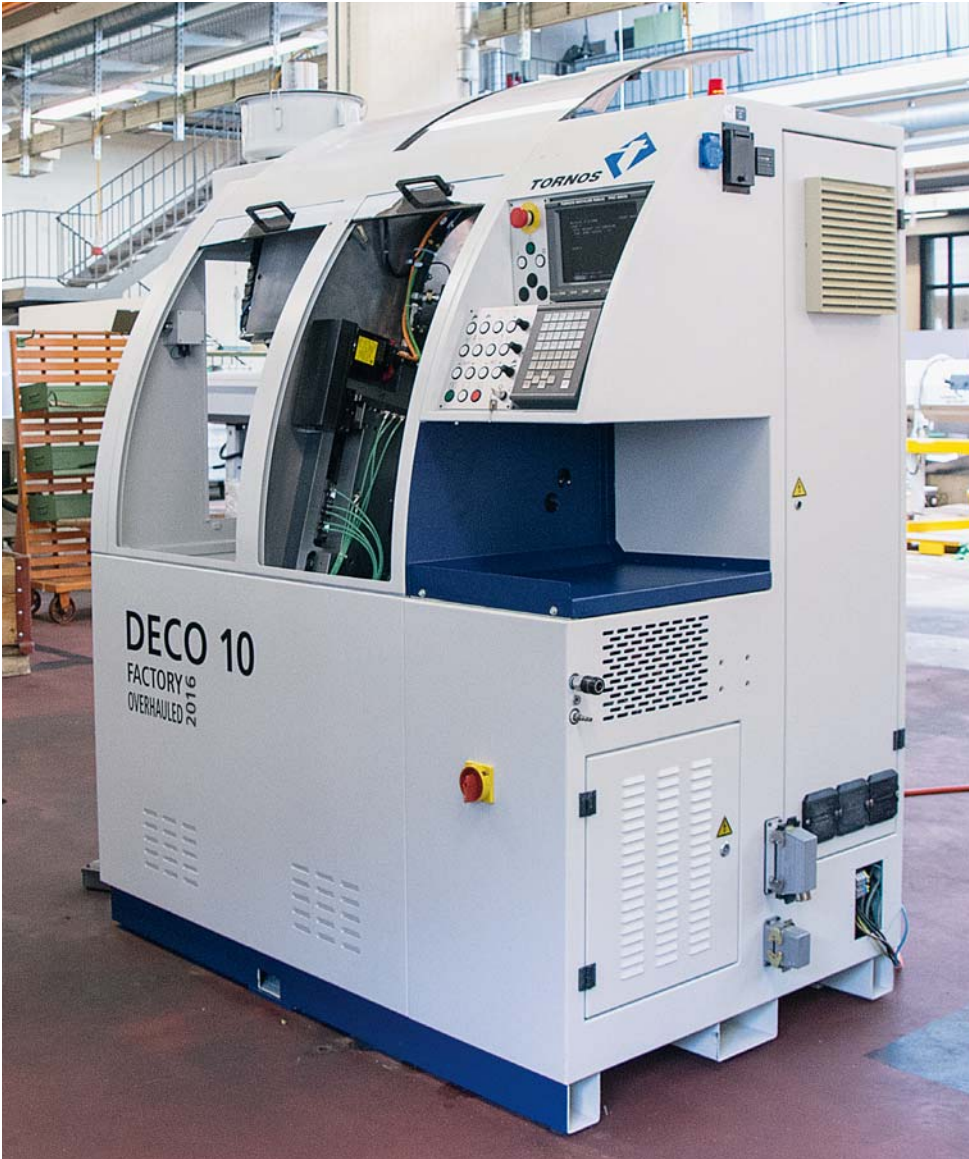
Tornos专家很快将对该Deco 10进行检查以便进行翻新。