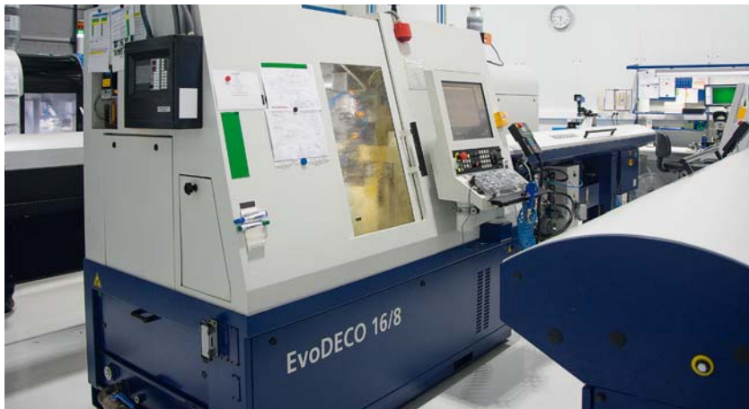
As máquinas EvoDeco da Tornos têm um papel importante no desenvolvimento da Mideos. Potência, características cinemáticas, tempo de ciclo, fiabilidade... tudo unido para garantir o sucesso.