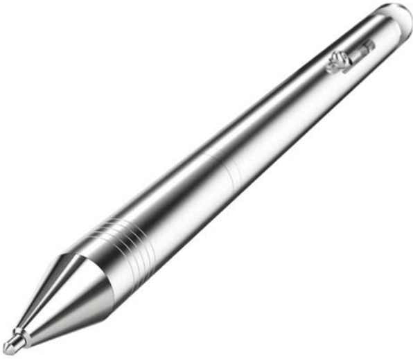
Un stylo sera réalisé sur le stand de l'IMTS.