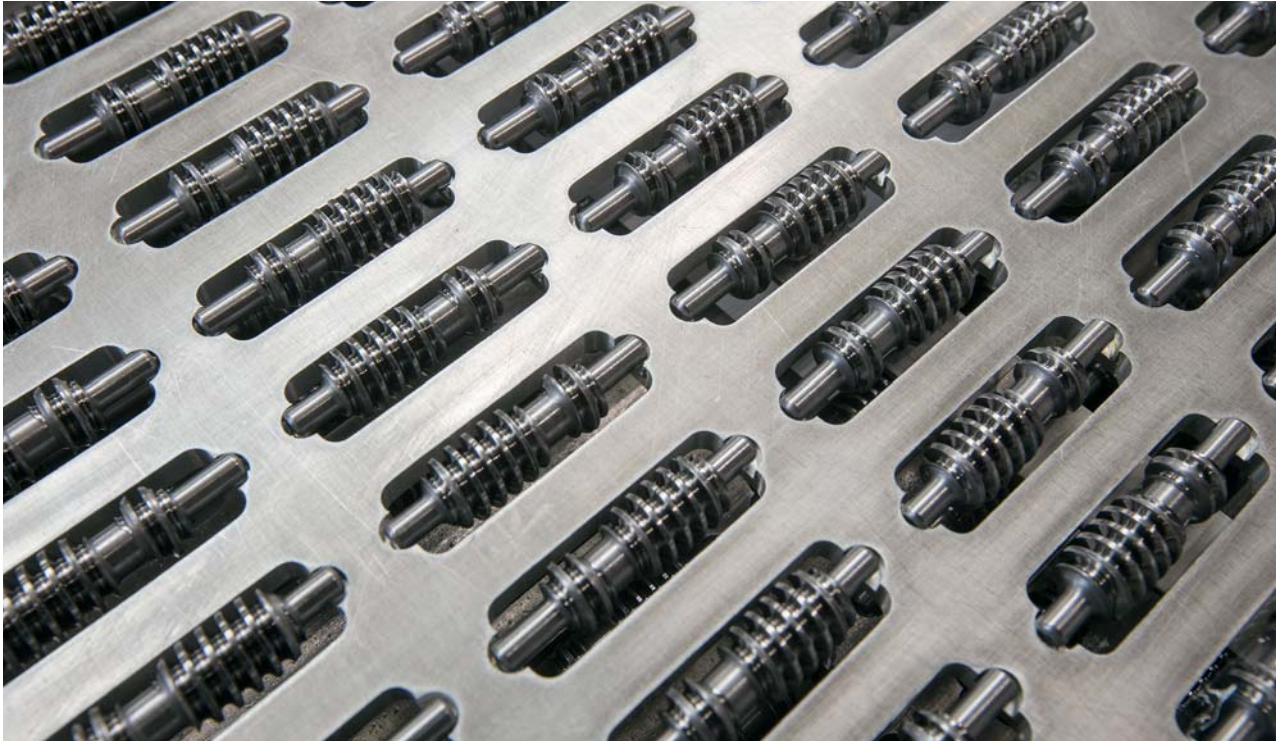
Teixidó满足最严格的客户要求

“这些机床可以超越单主轴型号的规格要求，提供稳定、高精度的加工。六轴结构使其十分高产；我们的每平方米零件产量大幅提高。这意味着MultiSwiss可以轻易替代单轴车床。”