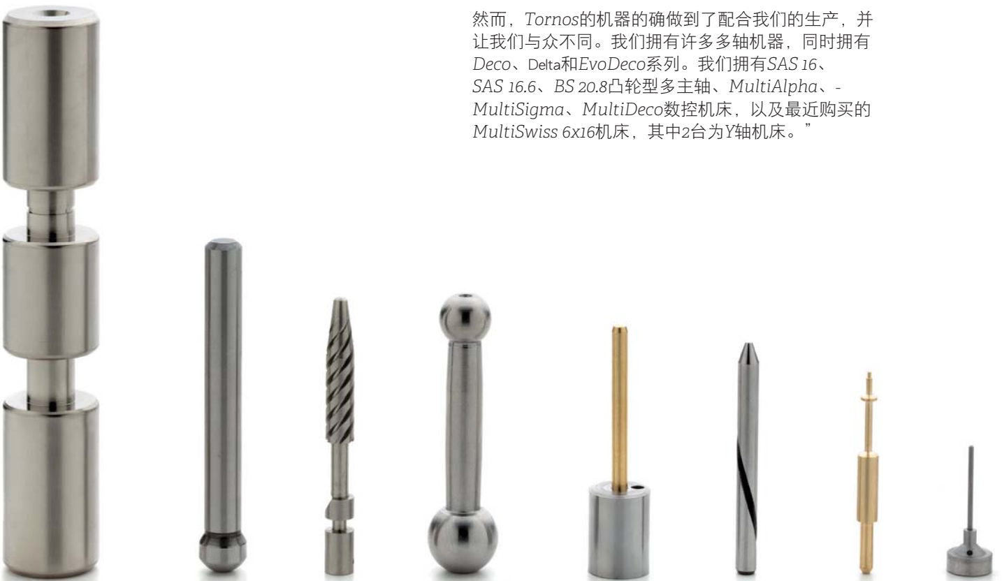
公司在众多商业领域拥有广泛的专业知识

然而, Tornos的机器的确做到了配合我们的生产, 并让我们与众不同。我们拥有许多多轴机器, 同时拥有 Deco、Delta和EvoDeco系列。我们拥有SAS 16、SAS 16.6、BS 20.8凸轮型多主轴、MultiAlpha、- MultiSigma、MultiDeco数控机床, 以及最近购买的 MultiSwiss 6x16机床, 其中2台为Y轴机床。”