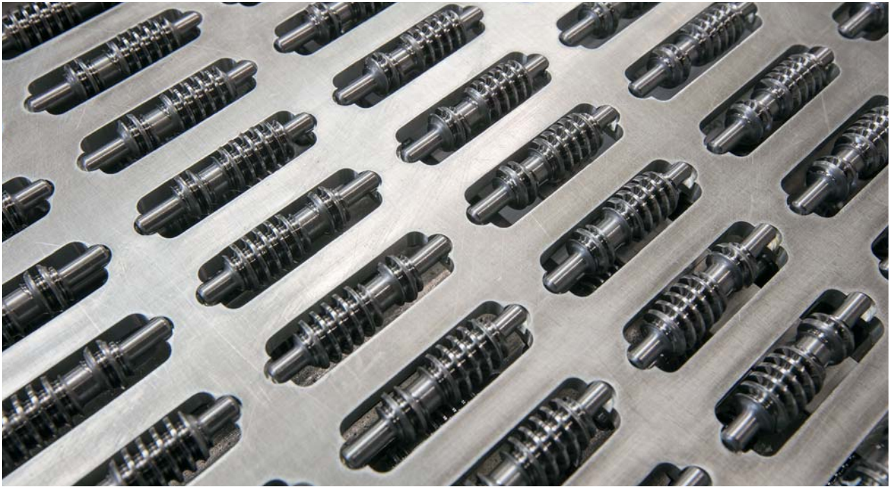
Teixidó cumple los requisitos más exigentes de su clientela.

Suiza». El servicio posventa de Tornos España es muy rápido, lo que constituye una ventaja que apreciamos sobremanera.