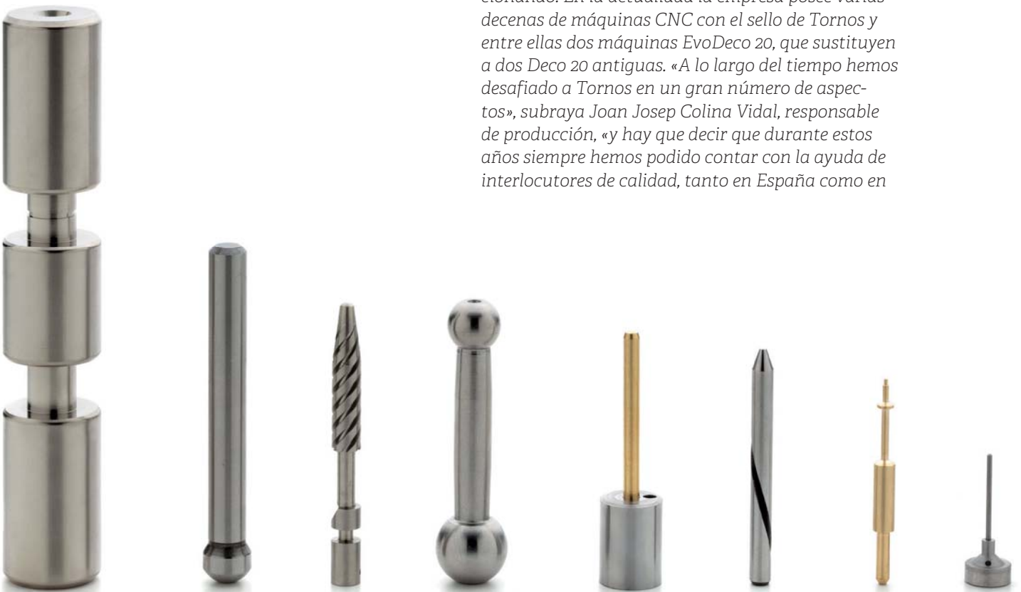
La empresa ofrece un amplio savoir-faire en numerosos sectores