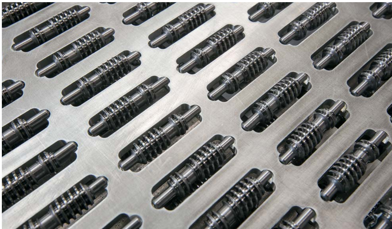
Teixidó soddisfa i requisiti più estremi dei suoi clienti.

Il servizio post vendita Tornos Spagna è rapidissimo e questo è un vantaggio molto apprezzato.