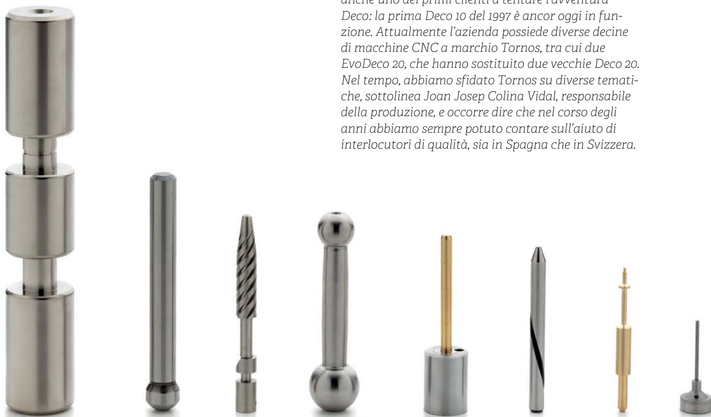
L'azienda dispone di un vasto know-how in numerosi settori di attività.