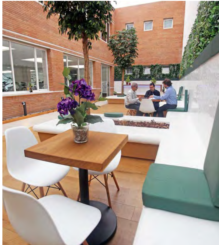
Drei Brüder, die durch eine gemeinsame Leidenschaft verbunden sind: die Herstellung hochwertiger Prothetikteile und Zahnimplantate.

„Für unsere Kunden ist die Tatsache, dass wir mit Tornos-Maschinen arbeiten, ein echter Gütebeweis.“