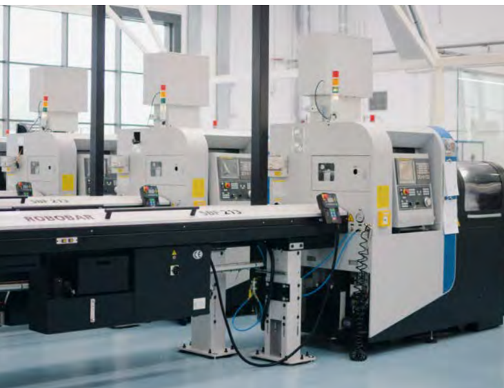
Terrats Medical verlässt sich weitgehend auf Tornos-Maschinen, wenn es darum geht, die Firma zukunftsfähig zu machen.

beträchtliche Anzahl an Patenten erworben. Die DESS Forschungs- und Entwicklungsabteilung ist sich der hohen Produktionsanforderungen bewusst und kann daher den Unterschied ausmachen, wenn es darum geht, ausgetretene Pfade zu verlassen, um innovative Lösungen für die Herstellung neuer Teile zu finden. Die ausgewiesenen Fachleute haben eine enorme Erfahrung und sind in der Lage, bestehende Schwierigkeiten basierend auf geballter Fertigungskompetenz und umfangreicher Qualitätskontrolle eingehend zu analysieren. Die gefertigten Teile werden einer umfassenden Prüfung unterzogen.