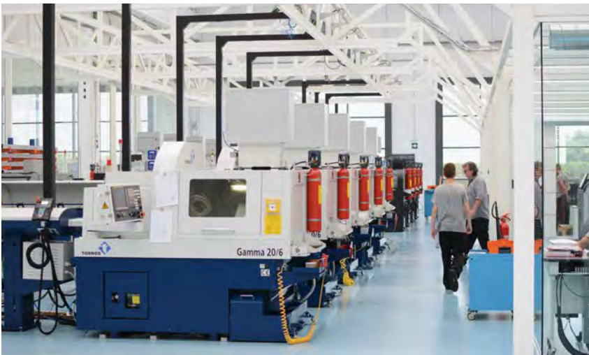
Die Werkstätten von Terrats Medical – der Inbegriff von Helligkeit und Sauberkeit

auf mehr als 2000 Referenznummern (nicht eingerechnet Teilefamilien), werden auf Lager gehalten. Das Lager ist voll computergesteuert und jeder Einzelposten ist in seiner eigenen Blisterverpackung verpackt. Terrats Medical ist nach ISO 9001 und ISO 13485 zertifiziert und besitzt neben der CE-Zulassung auch die US-amerikanische FDA- und die kanadische CMDCAS-Zulassung. Zusätzlich verfügt Terrats Medical über die erforderlichen Genehmigungen zur Herstellung von OEM-Teilen sowie zur Vermarktung von Teilen unter Eigenmarke.