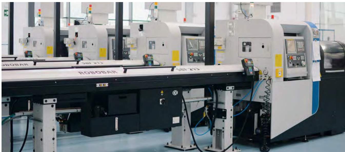
Terrats Medical fa affidamento in larga misura su macchine Tornos per garantire lo sviluppo dell'azienda.

consapevole delle richieste di produzione e può quindi fare la differenza quando pensa al di fuori degli schemi per trovare soluzioni innovative per la produzione di nuovi componenti. Gli specialisti hanno una grande esperienza e sono in grado di analizzare dettagliatamente le problematiche, basandosi sulla propria competenza accumulata e con un controllo qualità molto esteso. I pezzi prodotti sono sottoposti a controlli approfonditi.