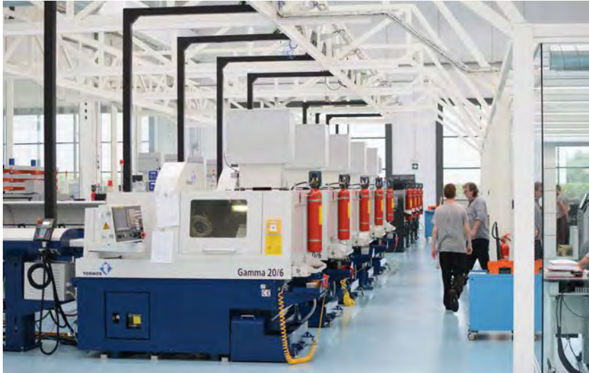
Le officine di Terrats Medical: un esempio di luminosità e pulizia.

completamente tramite computer e ciascuna voce è memorizzata con un suo imballaggio blister proprio. Terrats Medical è certificata in base a ISO 900 e ISO 13.485 e possiede la certificazione CE e FDA e quella canadese CMDCAS. Inoltre, Terrats Medical ha le certificazioni richieste per produrre pezzi per OEM o OBL.