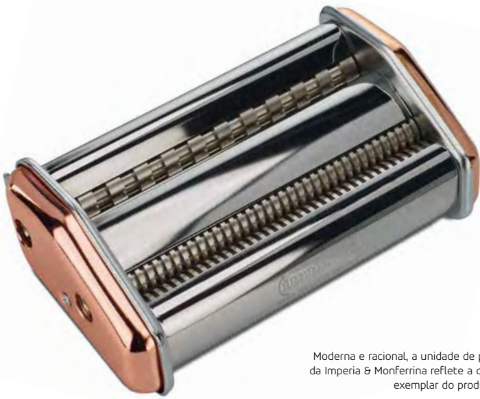
Moderna e racional, a unidade de produção da Imperia & Monferrina reflete a qualidade exemplar do produto final.

“Precisamos não apenas aumentar nossa capacidade de produção e encontrar máquinas mais potentes; nosso primeiro desafio foi substituir por aço inoxidável o aço AVZ que, tradicionalmente, usávamos nos roletes das nossas máquinas. Como nossas máquinas de torneamento de barras não eram suficientemente potentes, perdíamos muito tempo na produção de roletes de aço inoxidável. Por isso, precisávamos de uma máquina simples e potente para atender à demanda. Obviamente, procuramos a Tornos e Carlo Rolle em busca de orientação.”